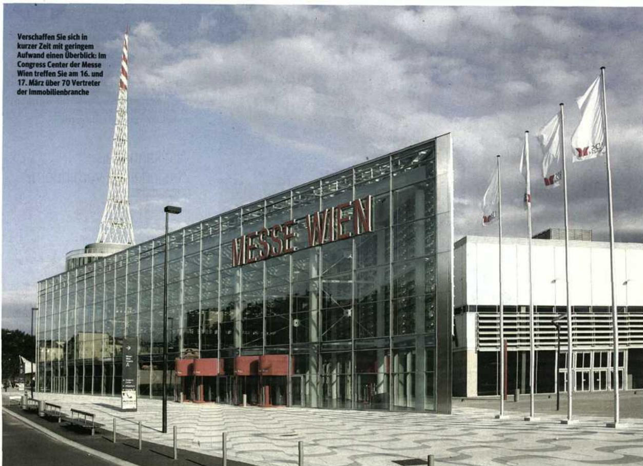
Verschaffen Sie sich in kurzer Zeit mit geringem Aufwand einen Überblick: Im Congress Center der Messe Wien treffen Sie am 16. und 17. März über 70 Vertreter der Immobilienbranche

Wohnraum in und rund um Wien. Kaufen oder verkaufen, mieten oder vermieten : Das Congress Center der Messe Wien